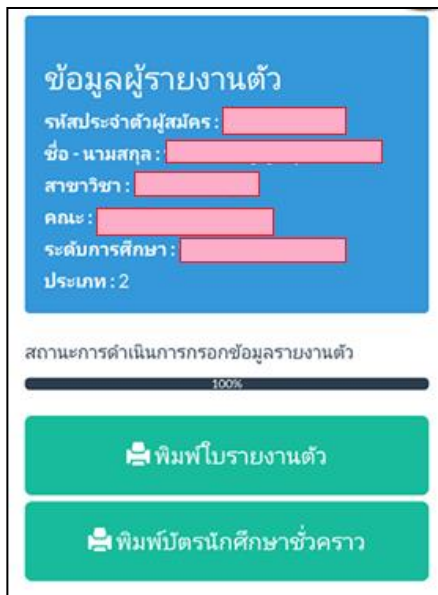
ภาพที่ ๓ หน้าพิมพ์บัตรนักศึกษาชั่วคราว