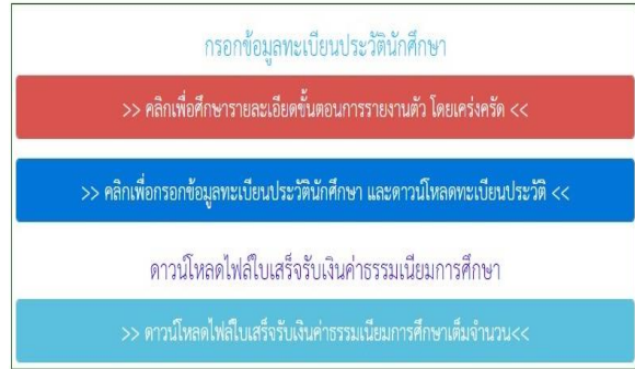
ภาพที่ ๒ คลิกเพื่อกรอกข้อมูลทะเบียนประวัติฯ